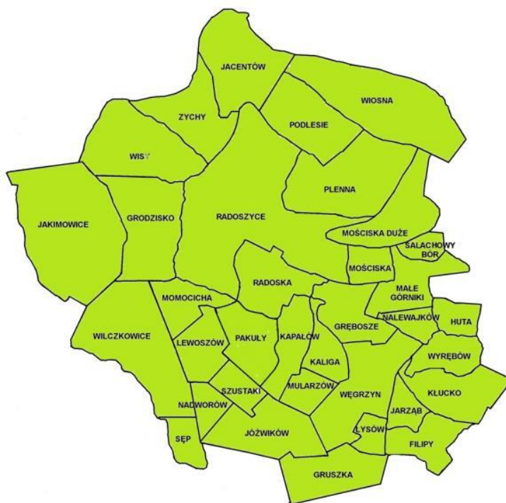
Mapa 1. Gmina Radoszyce w podziale na sołectwa.