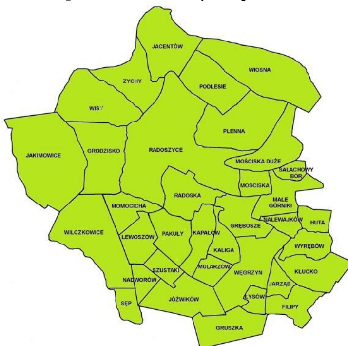
Mapa 1. Gmina Radoszyce w podziale na sołectwa.