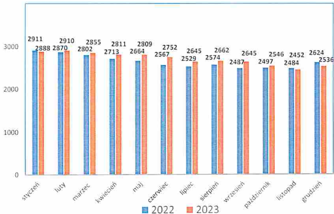
ZMIANY W POZIOMIE BEZROBOCIA W POWIECIE KONECKIM W LATACH 2022-2023

Na koniec grudnia 2023 roku stopa bezrobocia w powiecie koneckim wynosiła 10,2% i była niższa od stopy procentowej dla powiatu odnotowanej w końcu grudnia 2022r. o 0,3% . W tym okresie stopa bezrobocia dla kraju wynosiła 5,1% natomiast dla województwa świętokrzyskiego 7,8% .